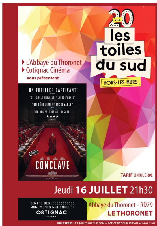
Affiche du festival Les toiles du sud hors les murs à l'abbaye du Thoronet