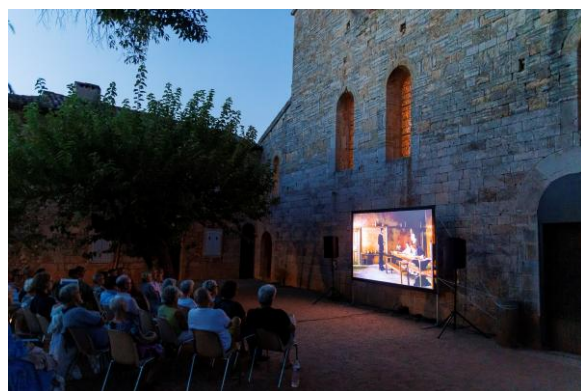
cinéma en plein air 2025