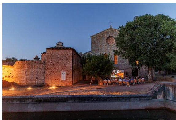
cinéma en plein air 2025