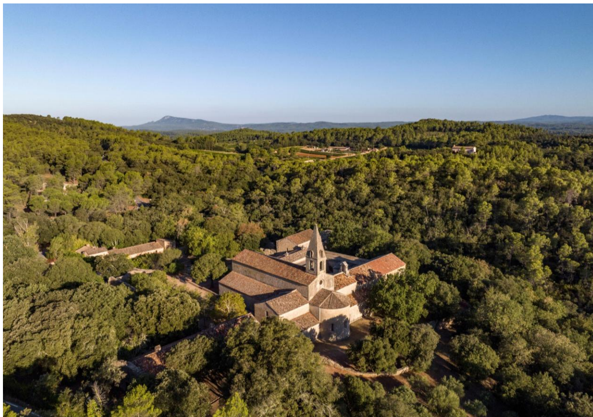
Vue aérienne de l'abbaye du Thoronet

Fondée par des moines de l'ordre cistercien au cœur des forêts de Provence, l'abbaye du Thoronet est édifée entre 1160 et 1190 et achevée en 1250. Elle constitue un ensemble architectural de l'époque romane présentant les caractéristiques de l'architecture cistercienne : pureté des lignes, simplicité des volumes et proportions harmonieuses. Avec les abbayes de Silvacane et Sénanque, l'abbaye du Thoronet est l'une des trois abbayes cisterciennes de Provence.