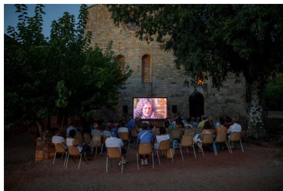
cinéma en plein air 2025