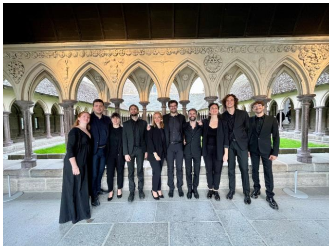
Dulce Jubilo à l'abbaye du Mont-Saint-Michel

Faire réseau est un objectif pour l'abbaye du Thoronet : Dulci Jubilo est en résidence à l'abbaye de Beaulieu-en-Rouergue, monument ouvert au public par le Centre des monuments nationaux. Elle offre à Christopher Gibert et à Dulci Jubilo un écrin de choix pour sublimer les voix. L'ensemble est Conventionné par la DRAC Occitanie, soutenu par la Région Occitanie, le Département de Tarn-et-Garonne, le Centre National de la Musique, la Spedidam, et de nombreux mécènes et bienfaiteurs. Il est également membre de la FEVIS et co-fondateur de la Fevis Occitanie.