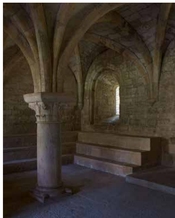
Abbaye du Thoronet, salle capitulaire