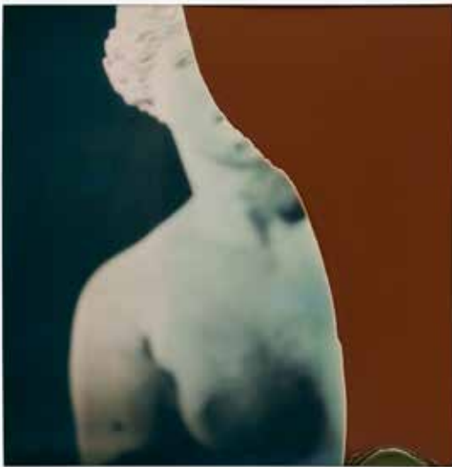
Fragment de venus

Dans le champ de la photographie, François Halard occupe une place singulière, celle d'un photographe d'architecture intérieure nourri par la passion des fragments antiques et archéologiques, des décors du XVIII e siècle, des peintures abstraites et radicales de la modernité et des photographies expérimentales et documentaires des années 1920. Il a une manière d'habiter la photographie qui a l'élégance des grands peintres. Comment dire et capturer ce que l'on a devant soi, cet indicible qui est l'épreuve irrésoluble du photographe, François Halard s'y confronte comme un peintre le fait, par la facture, le flou, l'éclairage low-key et les prises de vues successives, comme pour mieux donner une texture et une peau à tout ce qu'il capture. Il vit entouré des fragments récoltés et collectionnés au cours de ses voyages, qu'il n'a de cesse de mélanger, de surimposer et de faire dialoguer à travers le temps. Mais c'est dans le changement d'échelle de ses polaroids, certains altérés par une chimie instable, qu'il a su s'adonner à son tachisme minimal et extatique pour mieux brouiller le punctum. Tout processus créatif implique la chance, voire de temps à autre la grâce et il y a probablement une éthique dans l'usage du hasard, comme si le résultat pouvait apporter une nouvelle connaissance.