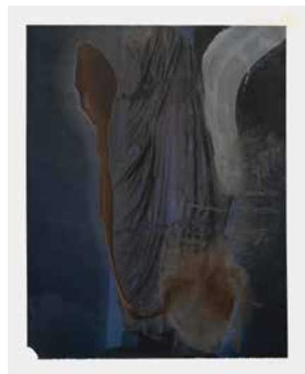
Fragment de drapé antique