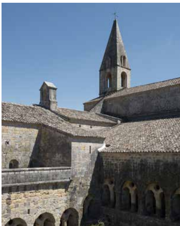
Abbaye du Thoronet, cloître et église abbatiale

Toute les infos sont à retrouver sur : https://www.le-thoronet.fr/