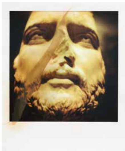
Portraits de Kosmêtês © François Halard