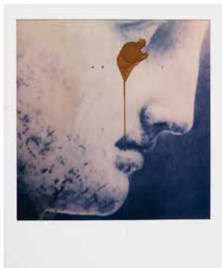
Coulure sous l'oeil de l'Hermès de Praxitèle © François Halard