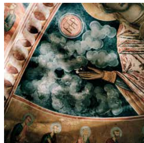
Monastère de Megalo Sotiris II, symi, grèce, 2018 © François Halard