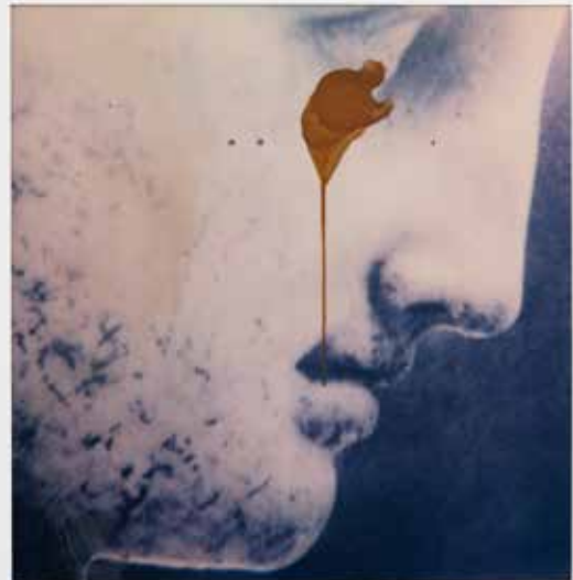
Coulure sous l'oeil de l'Hermès de Praxitèle