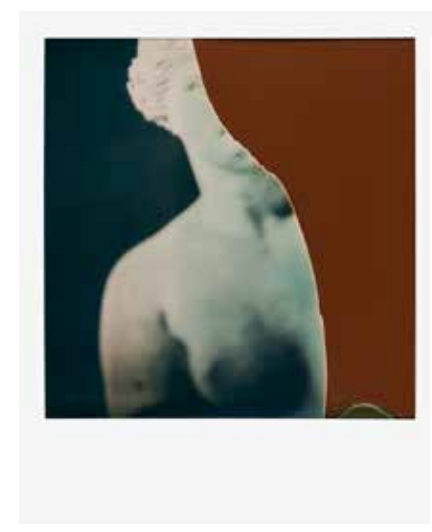
Fragment de venus © François Halard