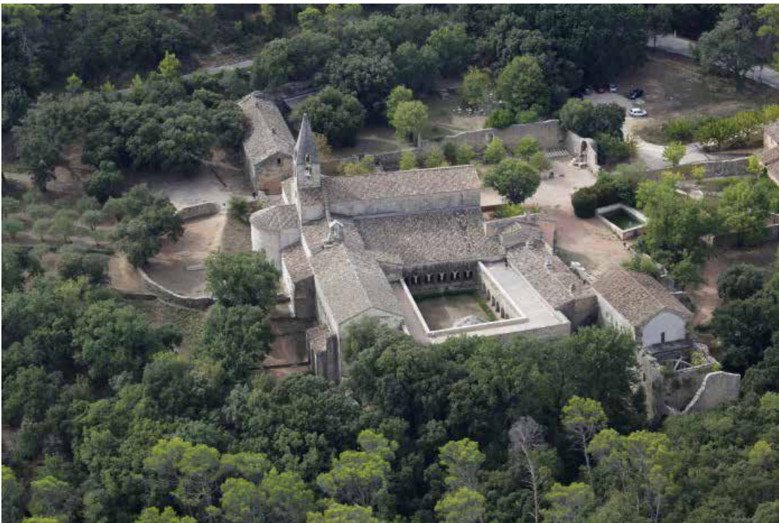
Abbaye du Thoronet

La gestion du site est confiée au Centre des monuments nationaux. Ce dernier en assure la conservation, l'ouverture à la visite et l'animation.