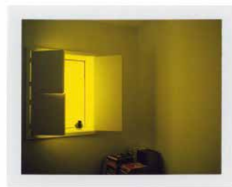
Barragán VI, mexique, 2018